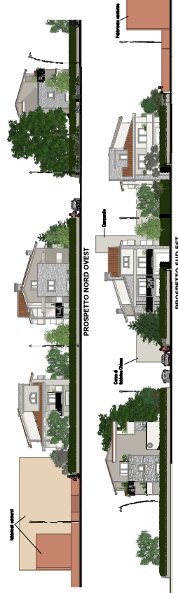
PROSPETTO NORD OVEST