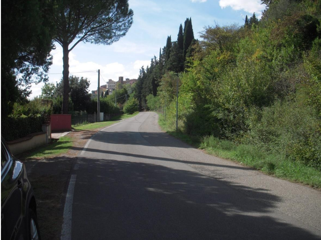
11-VISTA LATO OVEST