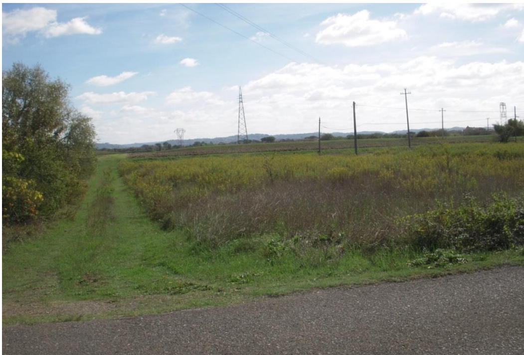
07-VISTA DA VIA LUNGOMONTE