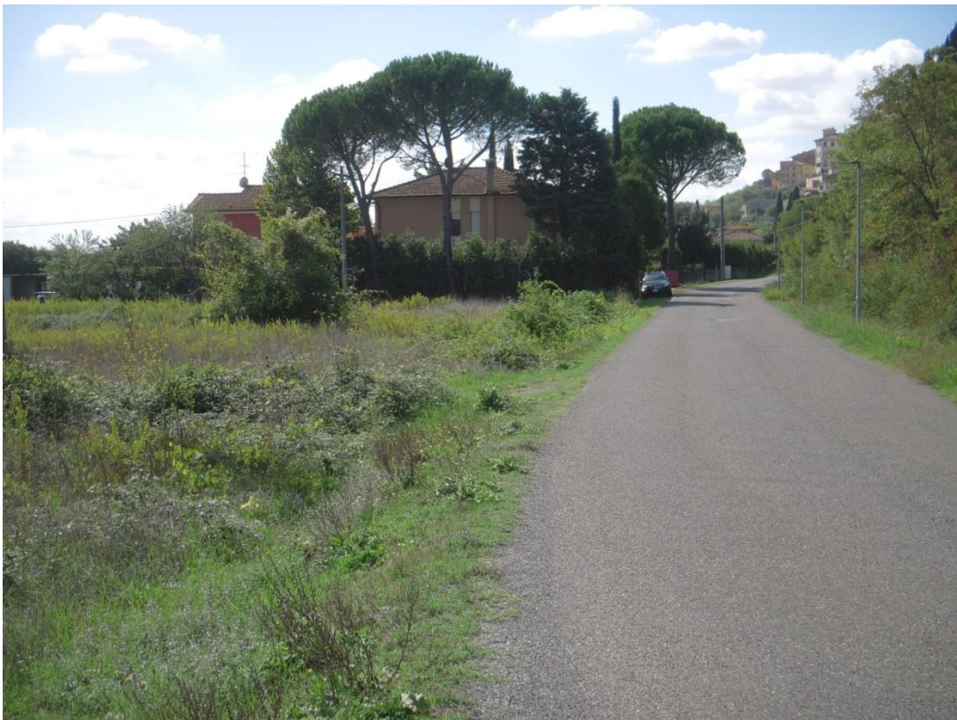
10-FOTO DI INSIEME LATO OVEST