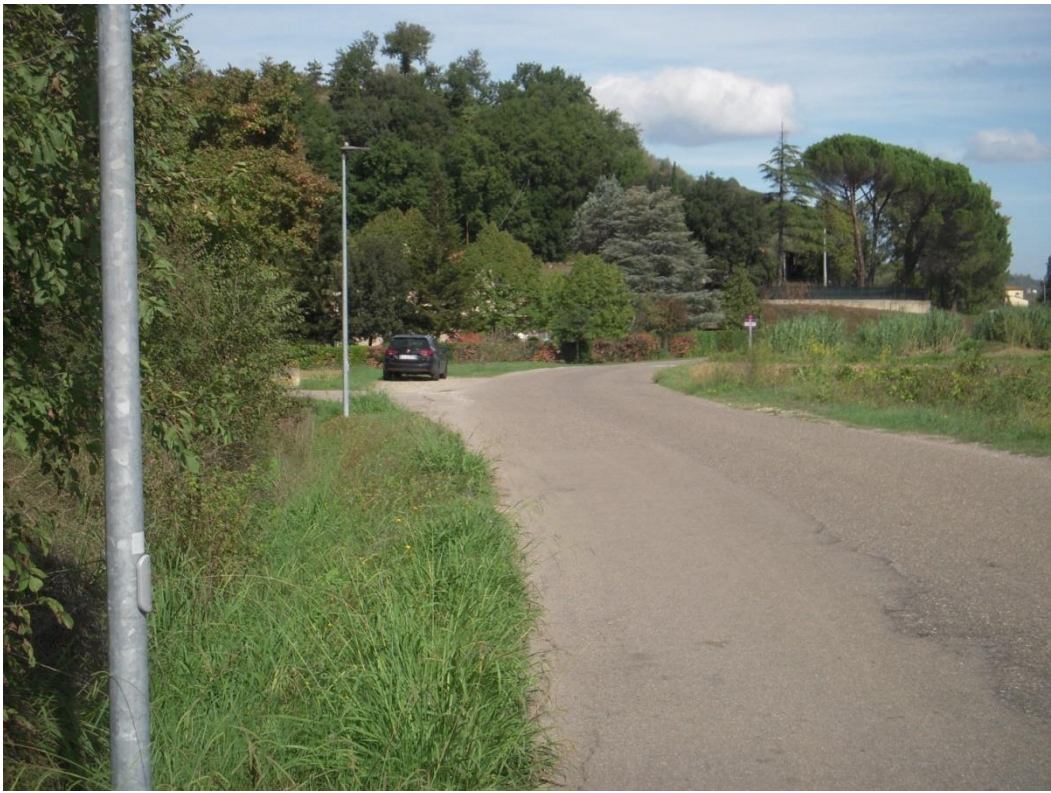
09-FOTO DI INSIEME LATO EST