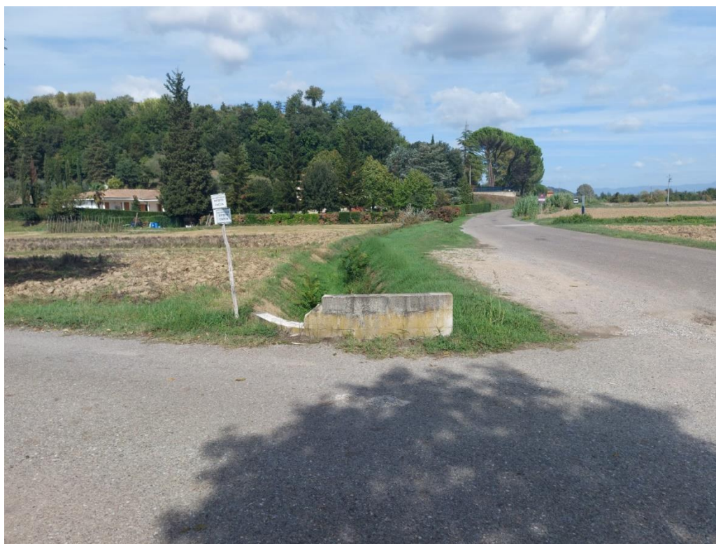
08-VISTA SU INCROCIO VIA CAPILATO