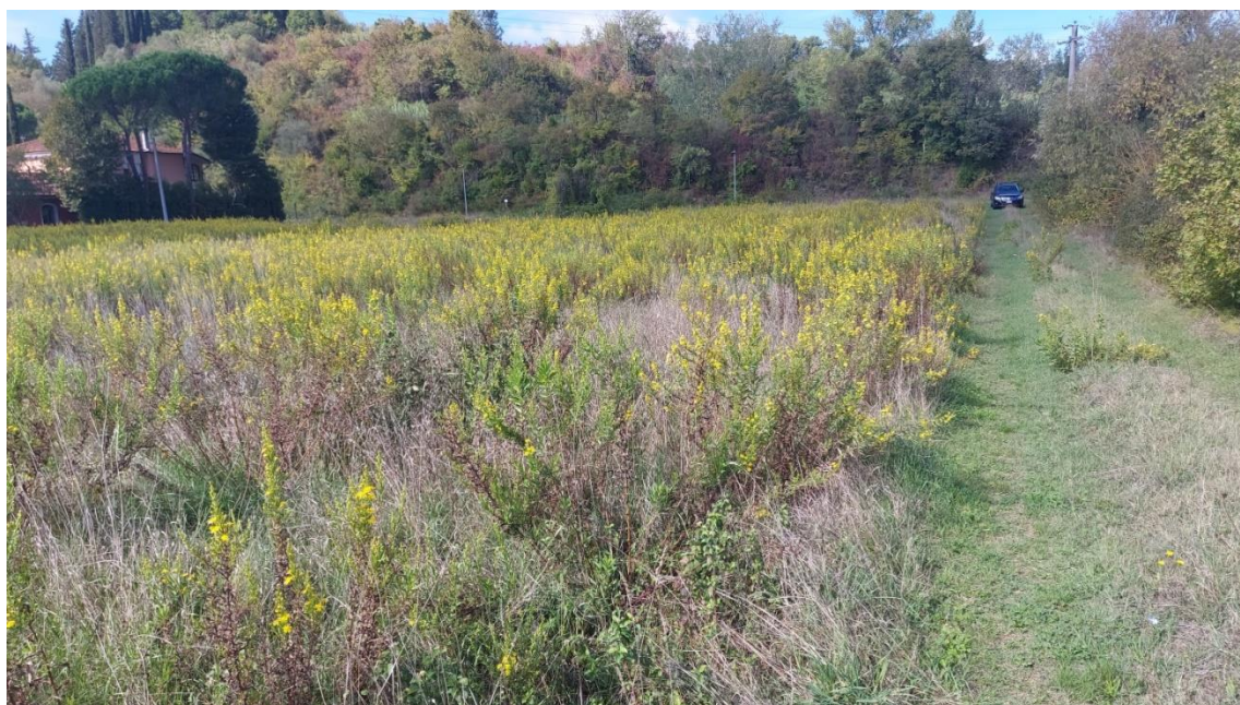
06-VISTA DI INTERNO