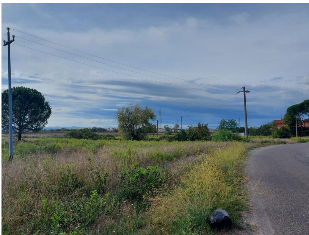
05-VISTA DA EST