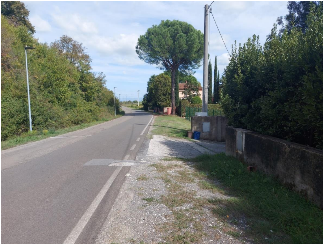
01-VISTA DA LATO PONTICELLI