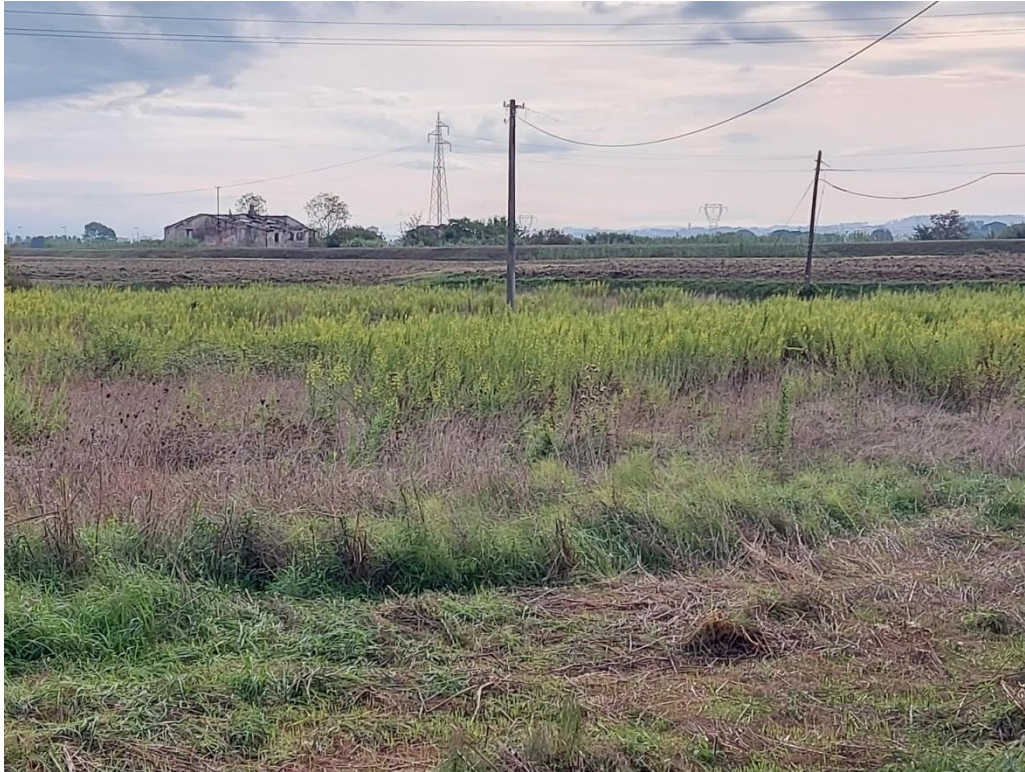
03- VISTA FRONTE SUD