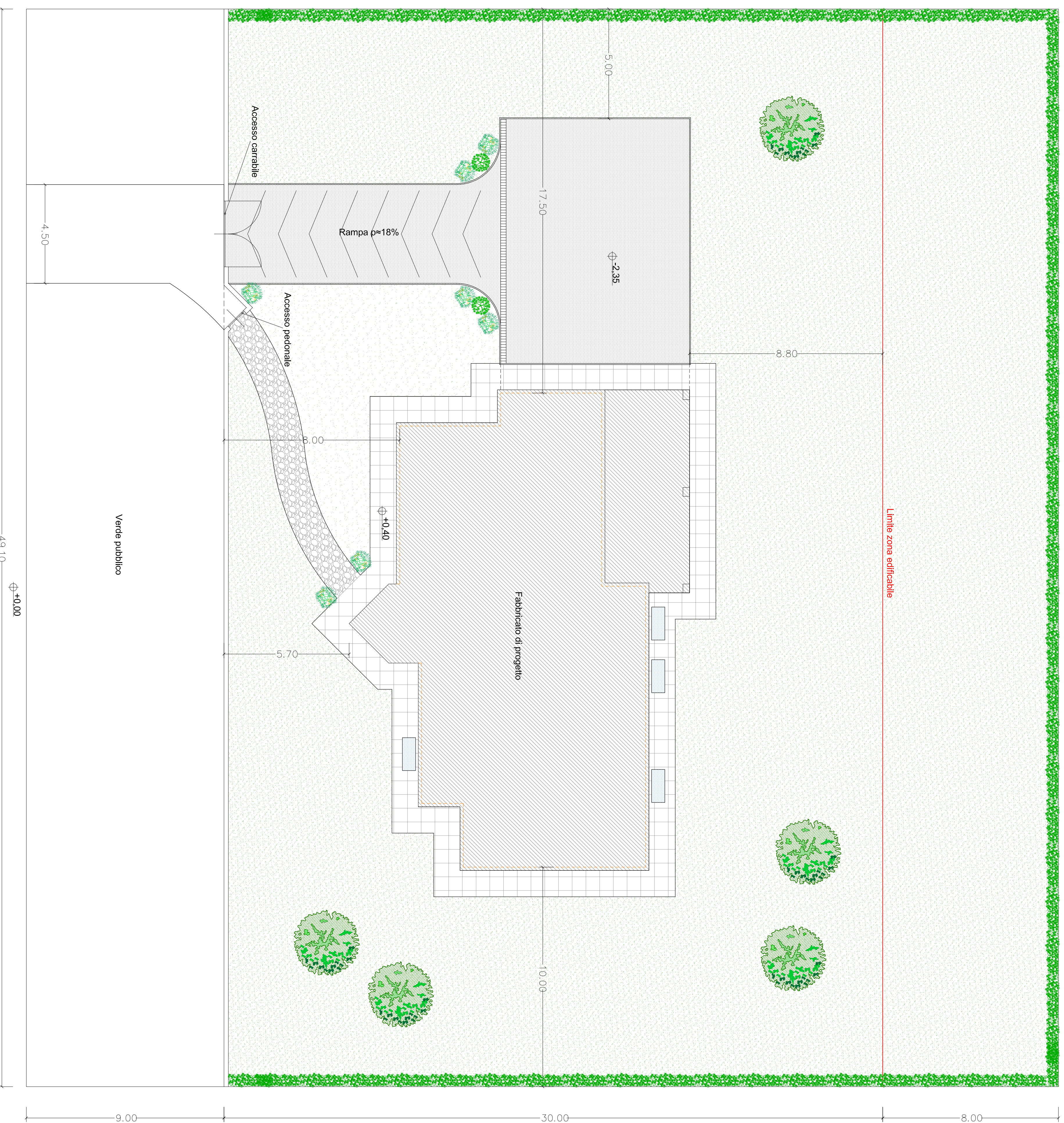
PLANIMETRIA GENERALE - SCALA 1:100